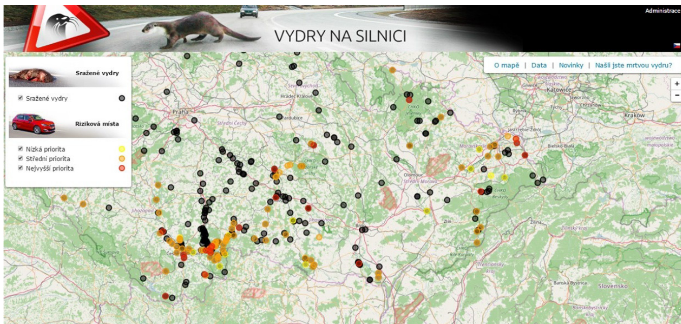
Náhled na mapovou aplikaci www.vydrnasilnici.cz .